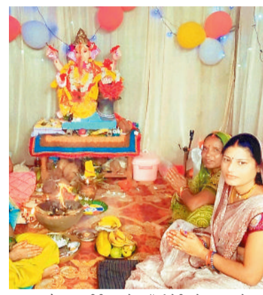
200 माईस चौक पूजा समिति कटकोना कॉलेरी में विराजे भगवान गणेश।