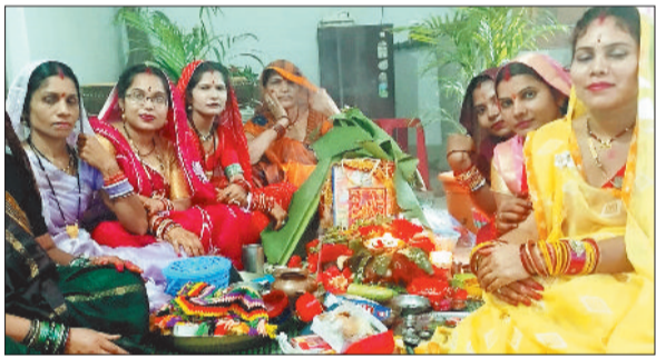
पूजा-अर्चना करती महिलाएं।

बिजुरी। कोयलांचल नगरी क्षेत्र के विभिन्न मंदिरों एवं धार्मिक स्थलों पर शनिवार 30 अगस्त को श्रद्धा और आस्था के साथ संतान सप्तमी व्रत का आयोजन किया गया। महिलाओं ने अपने संतान की दीर्घायु, सुख-समृद्धि और उत्तम स्वास्थ्य को कामना करते हुए यह व्रत रखा। सुबह से ही नगर के मंदिरों में महिलाओं की भीड़ उमड़ पड़ी। व्रतधारी महिलाओं ने पारंपरिक रीति-रिवाजों के अनुसार स्नान-ध्यान कर व्रत का संकल्प लिया और भगवान सूर्यदेव तथा संतान गोपाल की पूजा-अर्चना की। जगह-जगह पूजा-अर्चना और कथा श्रवण