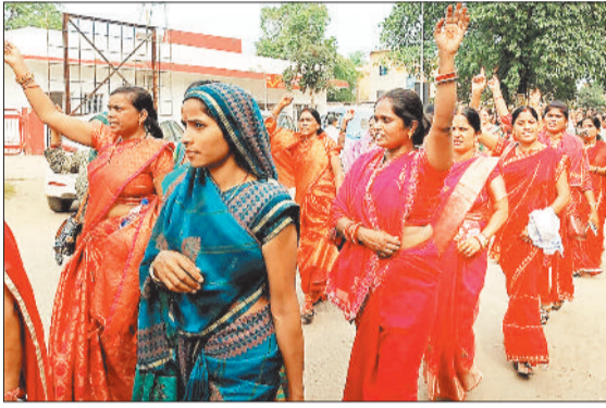
आंगनबाड़ी कार्यकर्ता एवं सहायिकाओं ने निकाली विशाल रैली।

रैली को संघ के पदाधिकारियों के द्वारा संबोधित कर सरकार से उनकी मांगों को पूरा करने को लेकर आवाज उठाई, इसके पश्चात जिलेभर से आए आंगनबाड़ी कार्यकर्ता एवं सहायिकाओं के द्वारा धरना स्थल से विशाल रैली प्रेमाबाग कॉलोनी होते हुए जनपद तिराहा होते रैली निकाल कर अपनी मांगों के समर्थन में ज्ञापन सौंपा गया। आयोजित प्रदर्शन में काफी संख्या में आंगनबाड़ी कार्यकर्ता एवं सहायिका शामिल रहे। इनके एक दिवसीय हड़ताल के कारण जिले के आंगनबाड़ी केन्द्रों में ताले लटकते रहे।