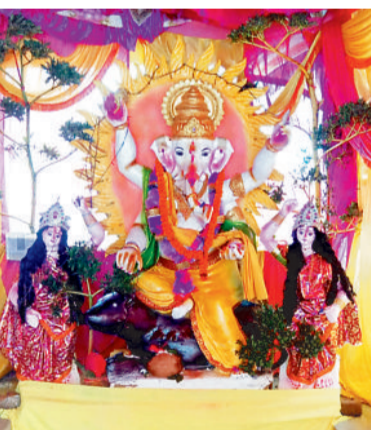
श्री श्री गणेश पूजा समिति टाडपट्ट चौक कटकोना।