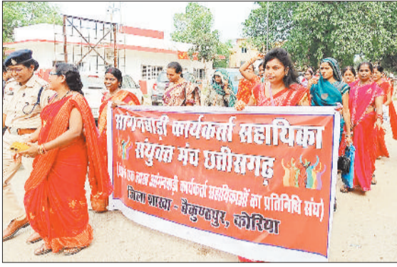
हरिभूमि न्यूज ►► बैकुंठपुर

कोरिया जिला मुख्यालय बैकुंठपुर में सोमवार को जिलेभर के आंगनबाड़ी कार्यकर्ताओं एवं सहायिकाओं के संयुक्त मंच छग के कोरिया ईकाई द्वारा उक्त संघ के बैनर तले आंगनबाड़ी कार्यकर्ता एवं सहायिकाओं के द्वारा अपनी मांगों को लेकर स्थानीय प्रेमाबाग मंदिर परिसर में एक दिवसीय धरना प्रदर्शन कर अपनी मांगों को लेकर आवाज बुलंद किया।