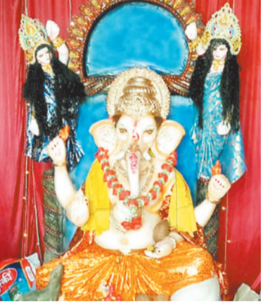
तुलसी मोहल्ला गणेश पूजा समिति कटकोना में विराजे भगवान गणेश।