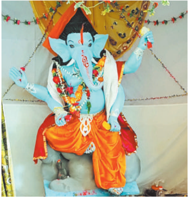
श्री गणेश पूजा सेना लाइन विवेकानंद कालोनी में विराजे भगवान गणेश।