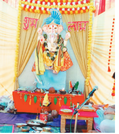
पुलिस चौकी सेवा समिति कटकोना में विराजे भगवान गणेश।