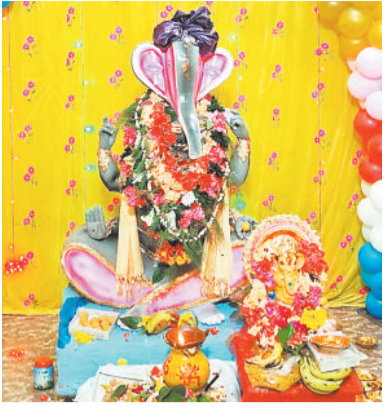
मनेन्द्रगढ़ शहर से लगे हनुमानपुरा चक्रवर्तीहंड में विराजे भगवान गणेश।