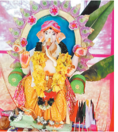
तुलसी चौक सेवा समिति कटकोना में विराजे भगवान गणेश।