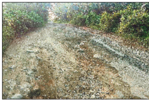
उत्तर छतीसगढ़ को मध्यप्रदेश से जोड़ने वाली नवाटोला-मकररोहर सड़क हुई खतरनाक

स्थानीय लोगों ने तत्काल इसकी सूचना चरचा पुलिस को दी। गनीमत रही कि जलती कार के पास खड़ी अन्य दो-तीन गाड़ियां सुरक्षित बच गईं। वाहन मालिक ने बताया कि रोज की तरह गाड़ी घर के सामने खड़ी की गई थी, लेकिन जब पड़ोसियों ने दरवाजा खटखटाकर जानकारी दी, तब तक कार पूरी तरह जल चुकी थी। उन्होंने इस घटना को असामाजिक तत्वों की करतूत बताते हुए प्रशासन से कड़ी कार्रवाई की मांग की। मोहल्लेवासियों ने बताया कि रविवार की रात व्हीटीसी