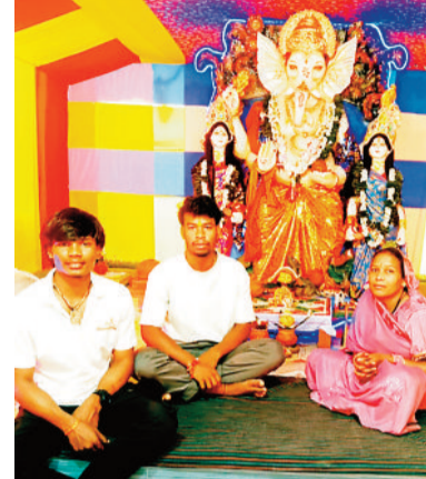
चाउंडपारा गणेश पूजा समिति कटकोना कॉलेरी।