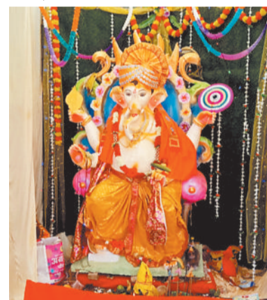
बरवट मोहल्ला पूजा समिति कटकोना में विराजे भगवान श्रीगणेश।