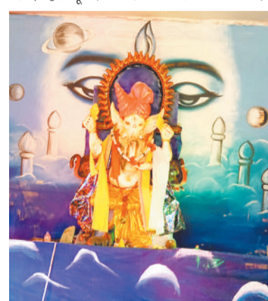
कोरिया चौक सेवा समिति कटकोना में विराजे भगवान गणेश।