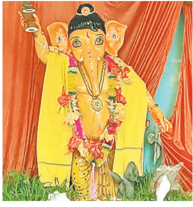
वाम पंचायत सरडी पण्डोपारा में विराजे भगवान श्री गणेश।