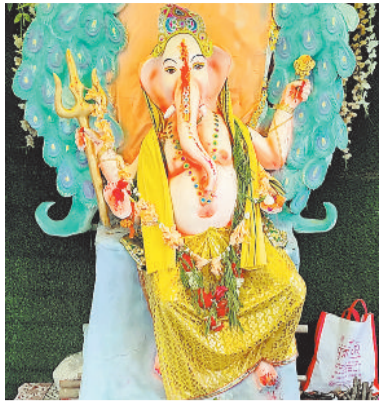
श्री गणेश पूजा सुभाष नगर इलेक्ट्रिक पावर रोड में विराजे भगवान गणेश।