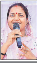
कहा किसानों के लिए पर्याप्त खाद उपलब्ध

गौरतलब है कि मुख्यमंत्री विष्णुदेव साय के मार्गदर्शन में खरीफ सीजन हेतु प्रदेश में 14.62 लाख मीट्रिक टन लक्ष्य के विरुद्ध 15.64 लाख मीट्रिक टन खाद का भंडारण कर 13.19 लाख मीट्रिक टन किसानों को वितरित किया जा चुका है, जिसमें 6.39 लाख मीट्रिक टन यूरिया शामिल है। साथ ही 5.30 लाख बोटल नैनो उर्वरक भंडारित कर 4.18 लाख बोटल यूरिया व अन्य खाद की कालाबाजारी रोकने और पारदर्शी वितरण सुनिश्चित करने के निर्देश दिए हैं।