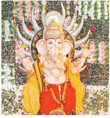
सर्वजनिक गणेश पूजा समिति विवेकानंद गाउंड करवा में विराजे भगवान गणेश।