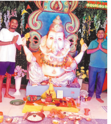
हनुमान चौक गणेश पूजा समिति कटकोना।