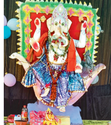
200 माईस सेवा समिति कटकोना में विराजे भगवान गणेश।